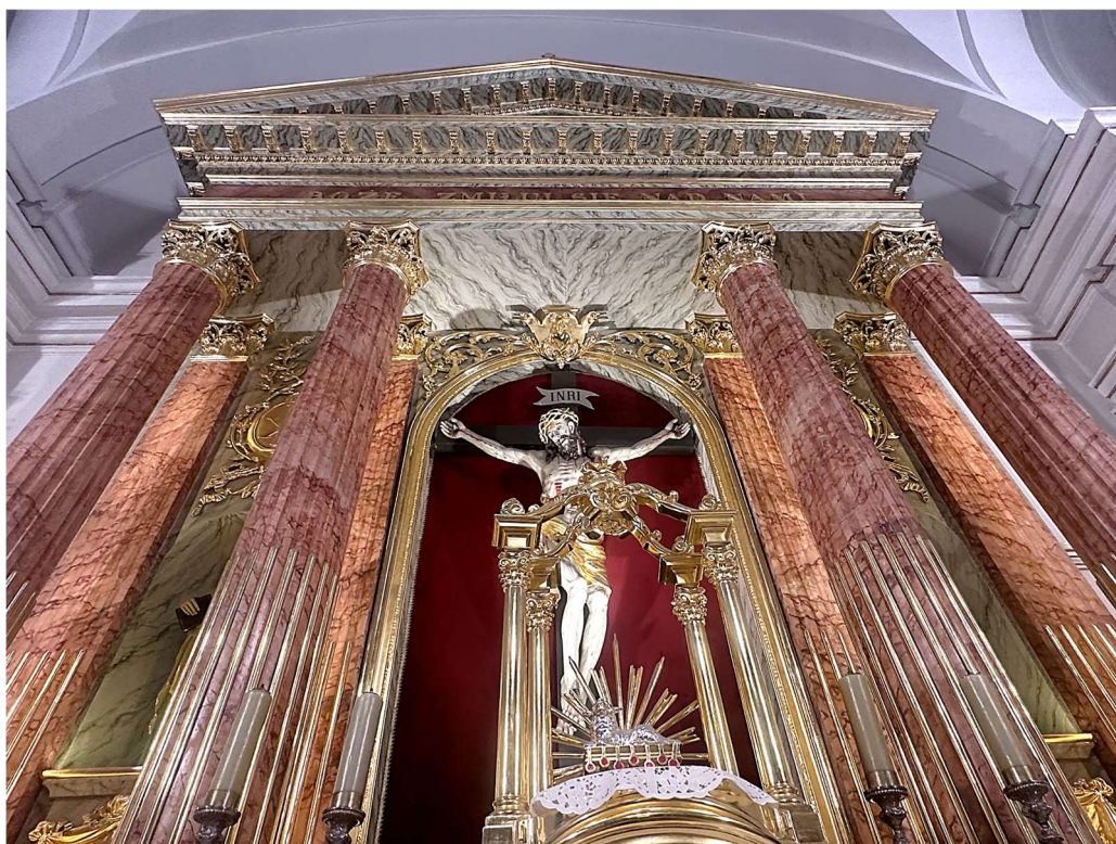
Fot. nr 9. XIX wiekowy ołtarz główny z kościoła parafialnego p.w. Narodzenia NMP w Mińsku Mazowieckim. Widok stanu istniejącego obiektu w listopadzie 2023 roku.

Niestety prowadzone w latach 2009-2011 prace konserwatorskie ambony i chrzcielnicy podczas których zmieniono ich kolorystkę nie uwzględniając rozwiązań pierwotnych zniekształciły estetykę samych obiektów a także wnętrza kościoła. Obecna białoszara marmoryzacja unifikuje się z jasnym wnętrzem ścian w przeciwieństwie do obecnej polichromii ołtarza głównego i prospektu organowego, która zostały wyeksponowana w latach 2028-2022 podczas prac konserwatorskich (Fot. nr 9, 10).