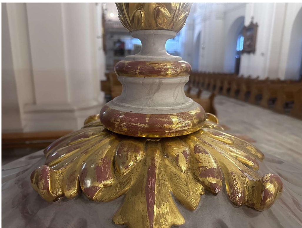
Fot. nr 6. XIX wieczna chrzcielnica z kościoła parafialnego p.w. Narodzenia NMP w Mińsku Mazowieckim. Widok uszkodzeń mechanicznych pozłoty na zwieńczeniu nakrywy misy.