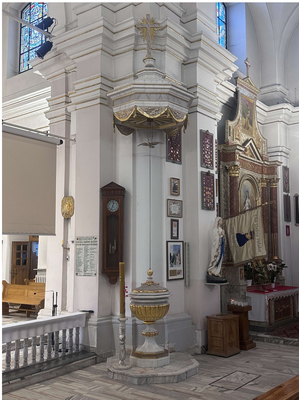
Fot. nr 3. XIX wieczna ambona z kościoła parafialnego p.w. Narodzenia NMP w Mińsku Mazowieckim. Widok całości obiektu w listopadzie 2023 roku.