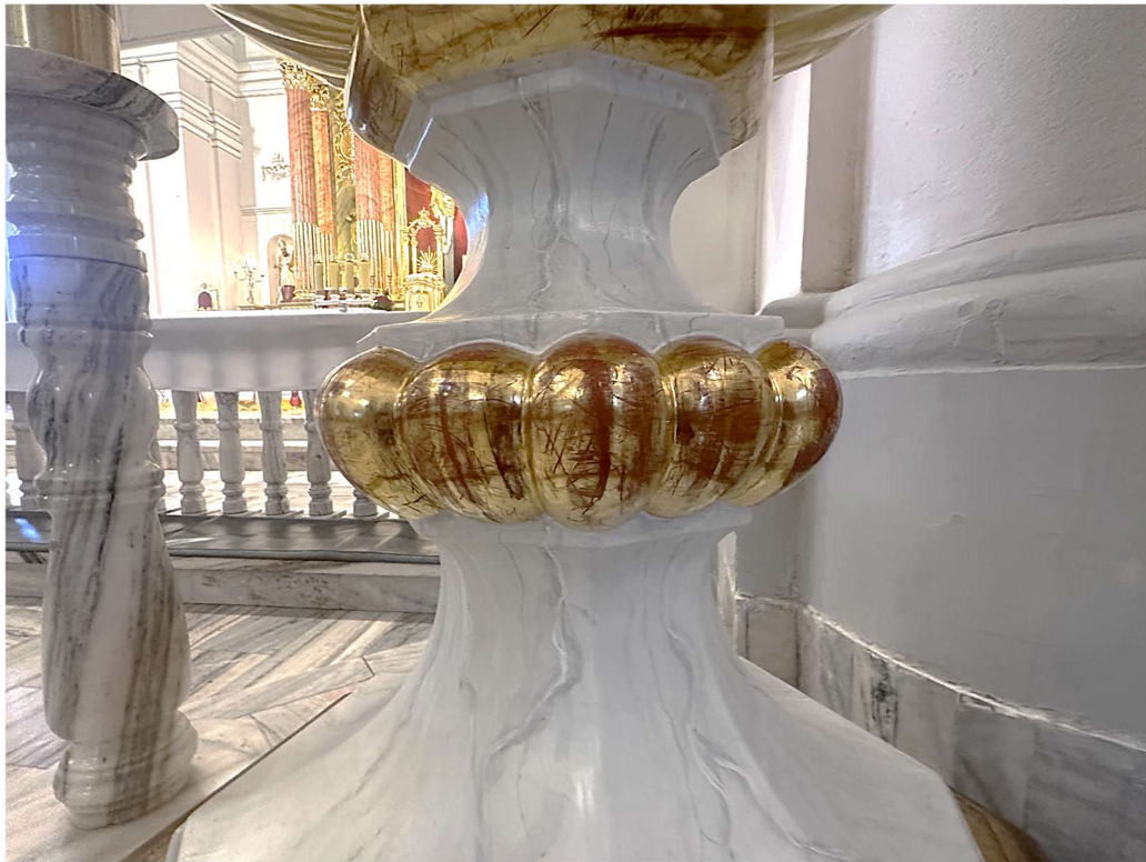
Fot. nr 7. XIX wieczna chrzcielnica z kościoła parafialnego p.w. Narodzenia NMP w Mińsku Mazowieckim. Widok uszkodzeń mechanicznych pozłoty w części środkowej obiektu.