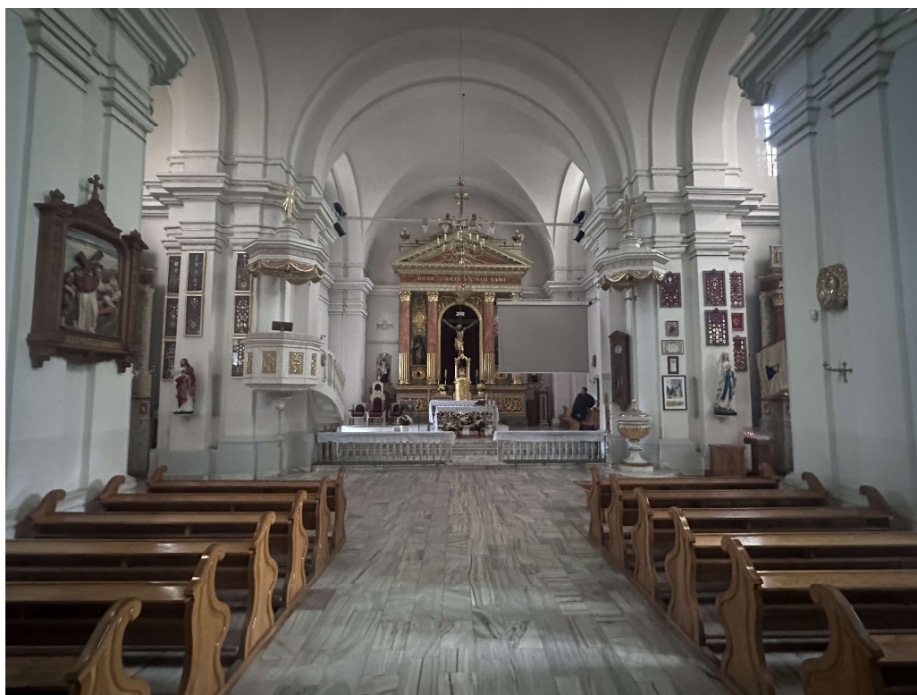
Fot. nr 1. Wnętrze kościoła parafialnego p.w. Narodzenia NMP w Mińsku Mazowieckim. Widok usytuowania ambony i chrzcielnicy.

Ambona i chrzcielnica wraz z ołtarzem głównym, prospektem organowym i balustradą stanowią spójne pod względem rozwiązań architektoniczno-rzeźbiarskich wyposażenie ruchome mińskiej świątyni (Fot. nr 1). Według wpisu do rejestru zabytków obiekty powstały w XIX wieku.