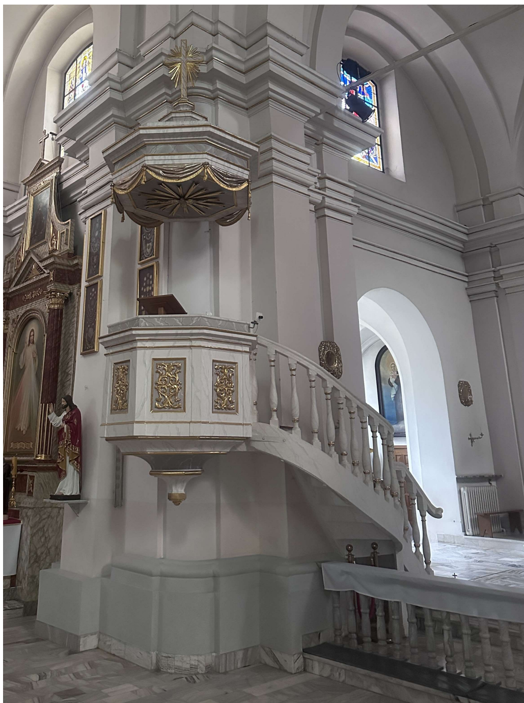
Fot. nr 2. XIX wieczna ambona z kościoła parafialnego p.w. Narodzenia NMP w Mińsku Mazowieckim. Widok całości obiektu w listopadzie 2023 roku.