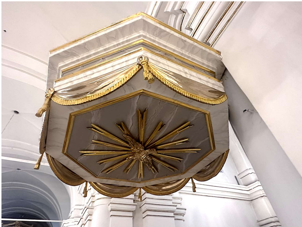
Fot. nr 8. XIX wieczna ambona z kościoła parafialnego p.w. Narodzenia NMP w Mińsku Mazowieckim. Widok dobrego stanu zachowania pozłoty na baldachimie.