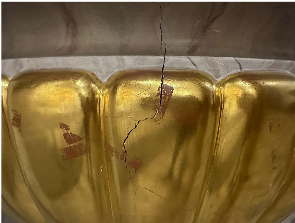
Fot. nr 5. XIX wieczna chrzcielnica z kościoła parafialnego p.w. Narodzenia NMP w Mińsku Mazowieckim. Widok spękania powstałego w wyniku zmian temperaturowo-wilgotnościowych.